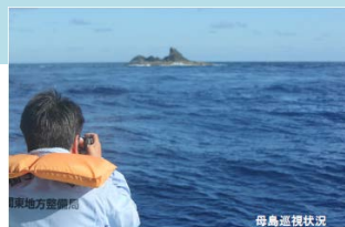
低潮線保全区域の巡視