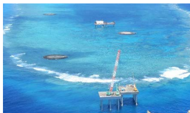
特定離島港湾施設の整備状況(沖ノ鳥島)