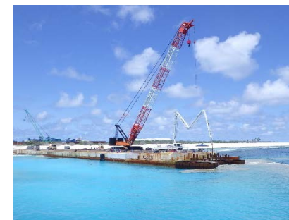
特定離島港湾施設の整備状況(南鳥島)