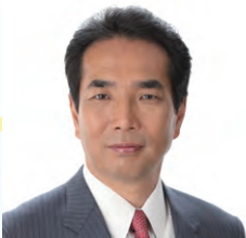
内閣総理大臣補佐官 江藤 拓

1960年宮崎県門川町生まれ。 2003年から衆議院議員、現在6期目。 2012年農林水産副大臣、2014年衆議院農林水産委員長。 2018年10月内閣総理大臣補佐官(ふるさとづくりの推進及び農林水産物の輸出振興担当)に就任、現在に至る。