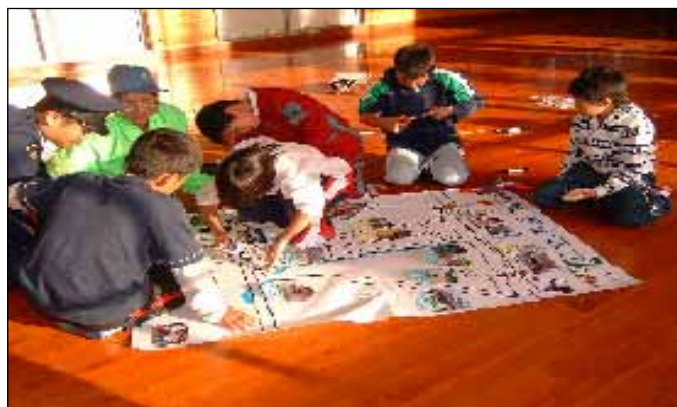
「地域安全マップ」の作成支援(高知県)