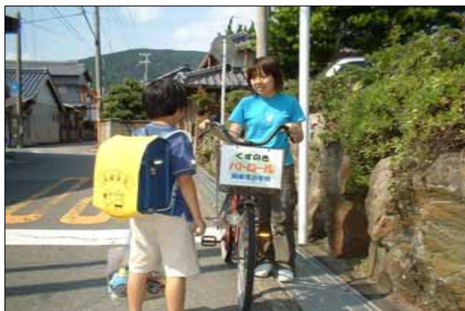
地域住民等による通学路のパトロールの支援(和歌山県)