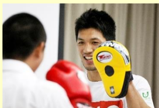
トッパスリートによる少年院訪問の様子