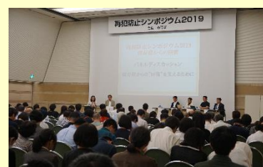
再犯防止シンポジウムの様子