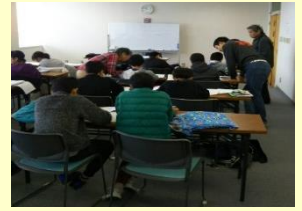
BBS会員と法務少年支援センターの連携による学習支援の様子