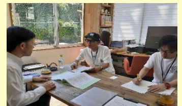
長崎ダルクへの訪問の様子