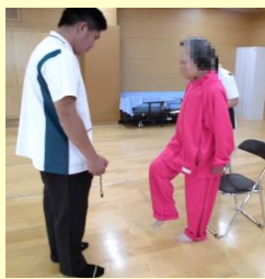
高齢受刑者に対する理学療法士による歩行訓練の様子

コラム ：女子施設地域連携事業による高齢受刑者を対象とした「いきいき体操（ロコモ体操）」の実施