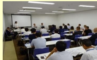
コレワークによる雇用支援 セミナーの様子