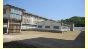
老朽化した刑事施設の外観の様子