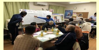
特定非営利活動法人による社会内問題回復プログラム実施の様子