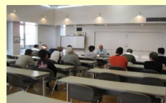
更生保護施設の処遇の様子