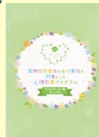
薬物依存症者をもつ家族支援のワークブック