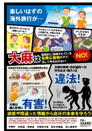
海外渡航者用ポスター