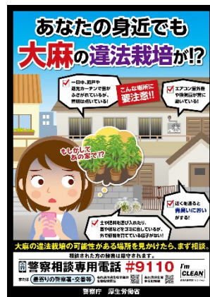
栽培情報提供ポスター