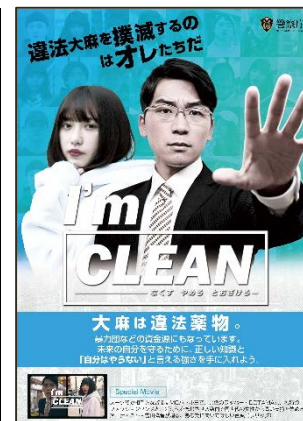
大麻対策ウェブサイト