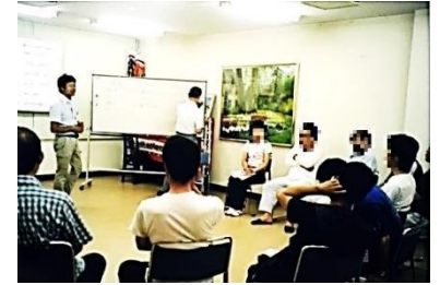
更生保護施設の処遇の様子