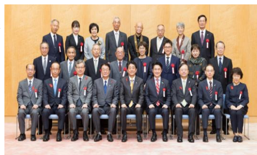
安全安心なまちづくり関係功労者表彰式の様子