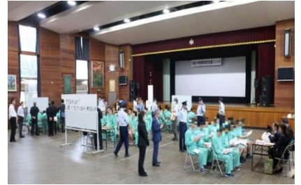
矯正施設の就労支援説明会の様子