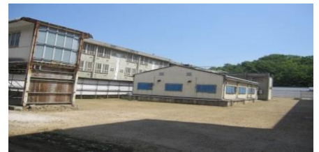
老朽化した刑事施設の外観の様子