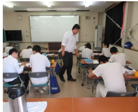
少年院における大学院講師による学習指導の様子