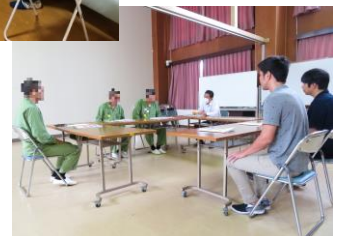
刑事施設の酒害教育の様子

・保健医療機関や民間団体、地方公共団体と連携した地域社会における支援・治療の継続