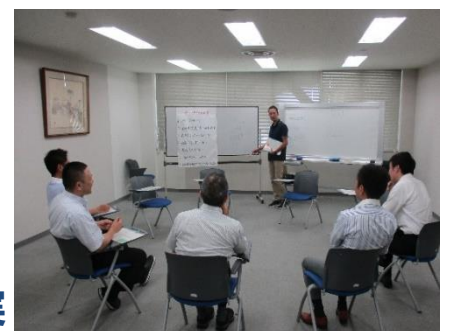
保護観察所の薬物再乱用防止プログラムの様子（イメージ）