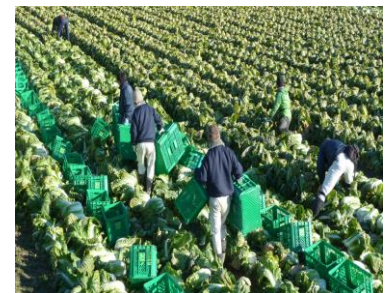
農福連携による取組の様子