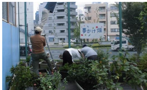
保護観察所における社会貢献活動（花と野菜の栽培）の様子