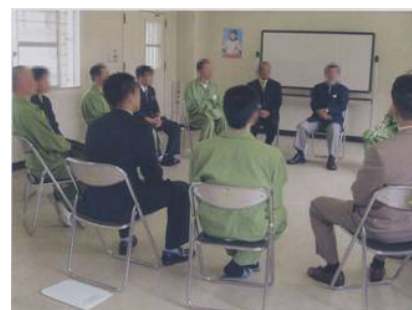
刑事施設における薬物依存離脱指導（グループワーク）の様子