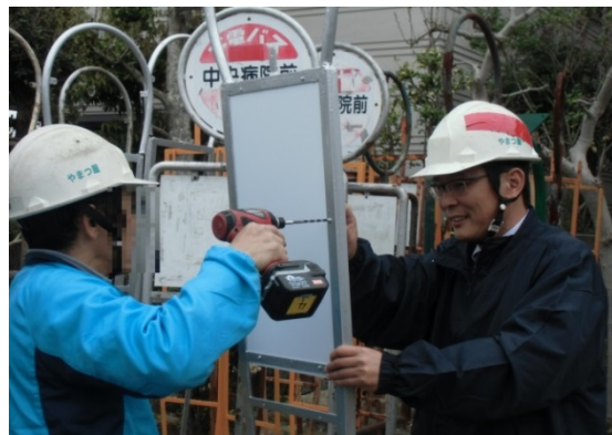
協力雇用主のもとでの就労の様子