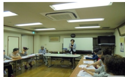
更生保護施設の処遇の様子