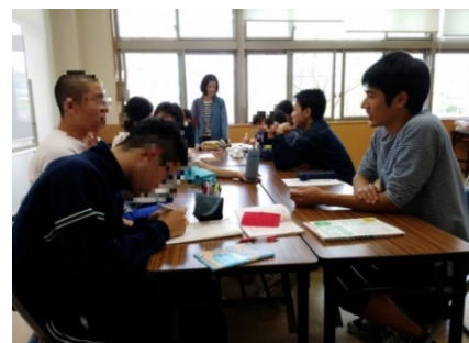
BBS会による学習支援の様子