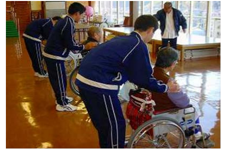
少年院における社会貢献活動の様子

→性犯罪者・性非行少年、ストーカー加害者、暴力団関係者、少年・若年者、女性、発達上の課題を有する者等の特性に応じた指導や支援の充実