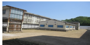
老朽化した刑事施設の外観の様子