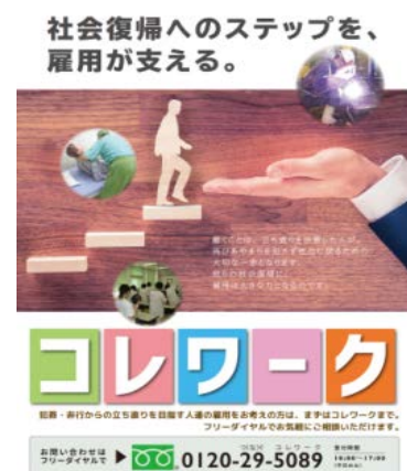
「コレワーク」のポスター

→ 協力雇用主等に対するパンフレット配布や研修等を通じた就労支援制度に関する情報提供 → 協力雇用主の不安・負担の軽減