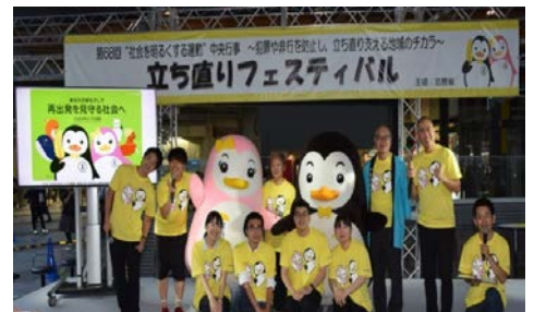
“社会を明るくする運動”の様子

→少年警察ボランティアや更生保護ボランティアの活動に対する支援の充実 →更生保護サポートセンターの設置の推進