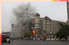
本年11月、ムンバイで 大規模なテロ事件が 発生