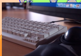
サイバーテロ・サイバー インテリジェンス 活動