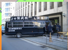
国内の極左暴力集団、 右翼等の活動