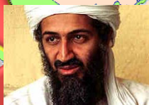
アル・カーイダから テロの標的として 名指し