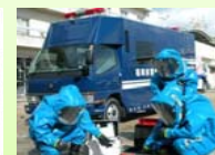
NBCテロ対応 専門部隊