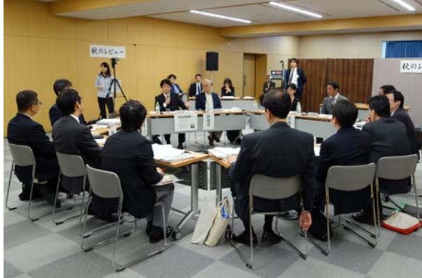
外部有識者と各府省担当者との議論の様子を視察(11月14日秋のレビュー会場にて)