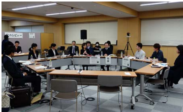
「秋のレビュー」の最後に、大学生らと議論(11月15日秋のレビュー会場にて)