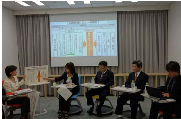
インターネット生放送番組に出演(11月7日プレセッション生放送スタジオにて)