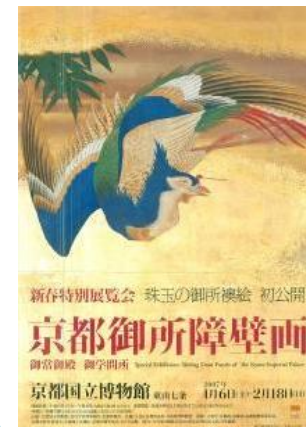
「京都御所障壁画展」 (京都国立博物館)