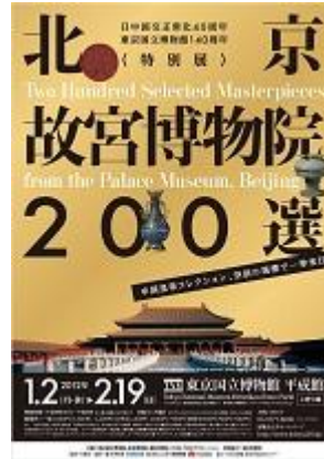
「北京故宮博物院200選」 (東京国立博物館)