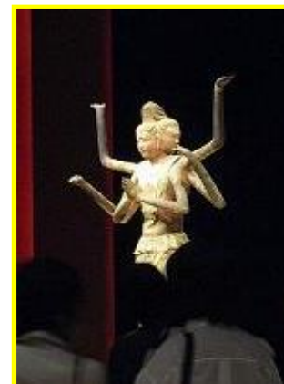
貴重な文化財の展示・公開 (阿修羅展)