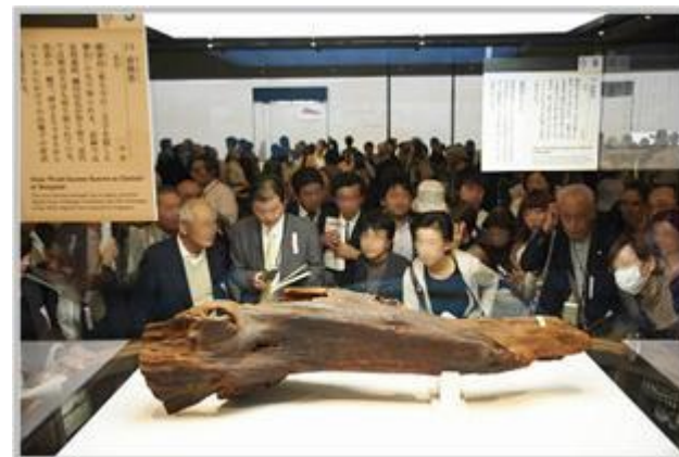
魅力的な展覧会の開催（正倉院展）