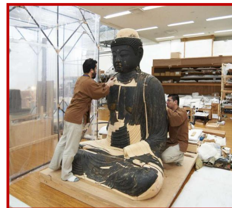
劣化した文化財(仏像)の修理