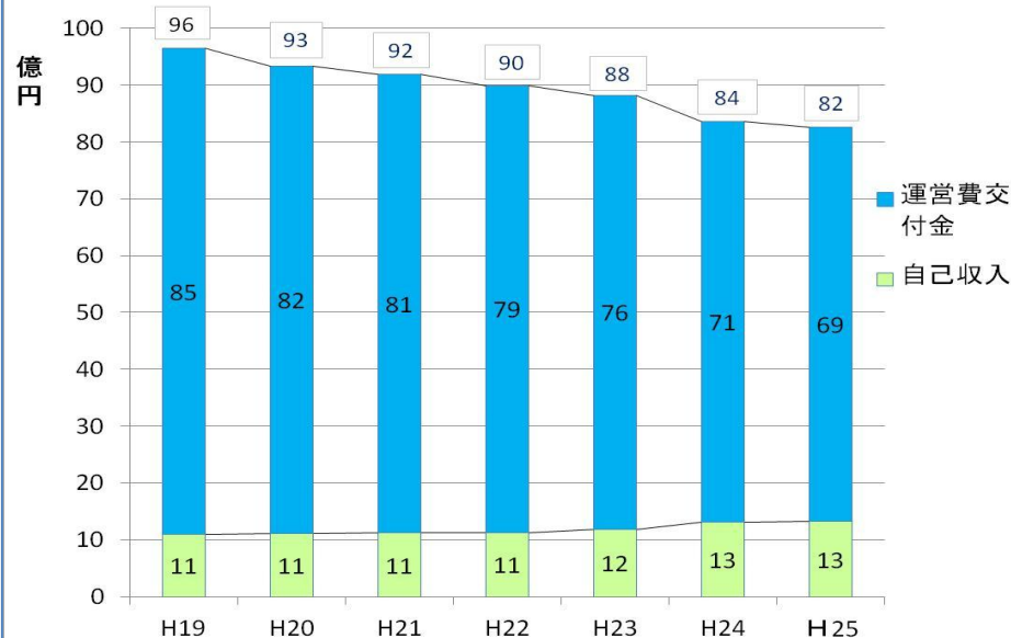
財源の推移(運営費交付金・自己収入別)