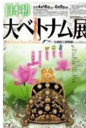
「大ベトナム展」 (九州国立博物館)