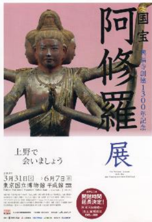
「国宝阿修羅展」 (東京国立博物館)