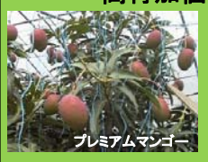
プレミアムマンゴー