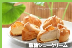
黒糖シュークリーム