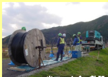
光ファイバー敷設