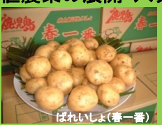
ばれいしょ(春一番)