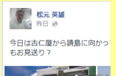
フェイスブックの活用