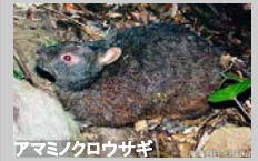
アマミ/クロウサギ