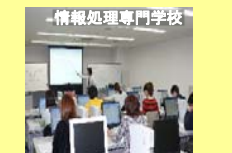
情報処理専門学校