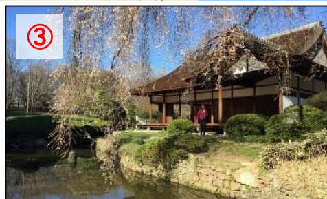
(フィラデルフィア市)