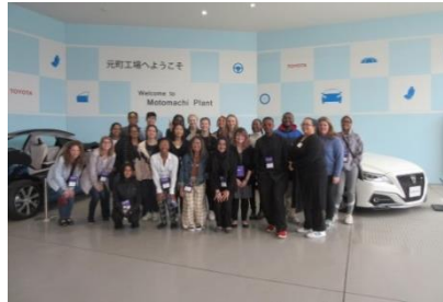
トヨタ自動車元町工場訪問