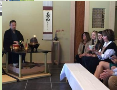
改修された茶室における裏千家東大阪支部師範による点前