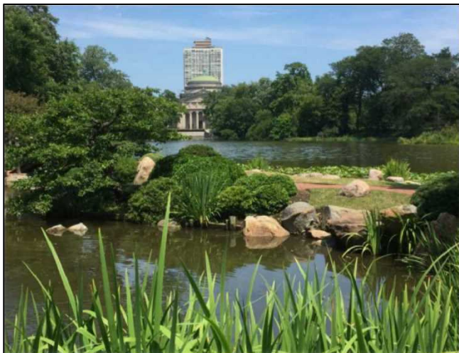
①イリノイ州シカゴ市 ジャクソンパーク日本庭園