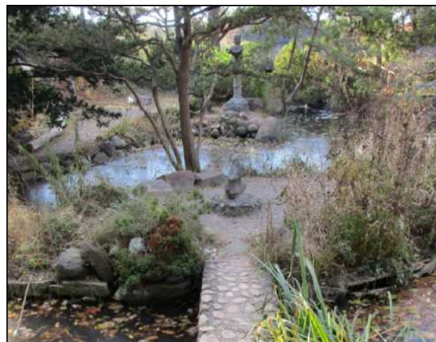
②ミシガン州ブルームフィールド郡 クランブルック・ハウス・アンド・ガーデンズ日本庭園