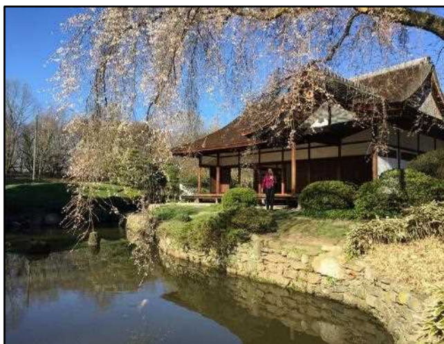
③ペンシルベニア州フィラデルフィア市 フェアマウント公園松風荘庭園(神戸市と連携して実施)