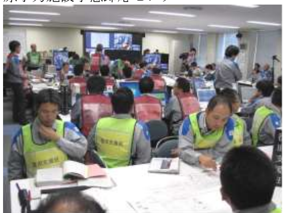
原子力施設事態即応センター