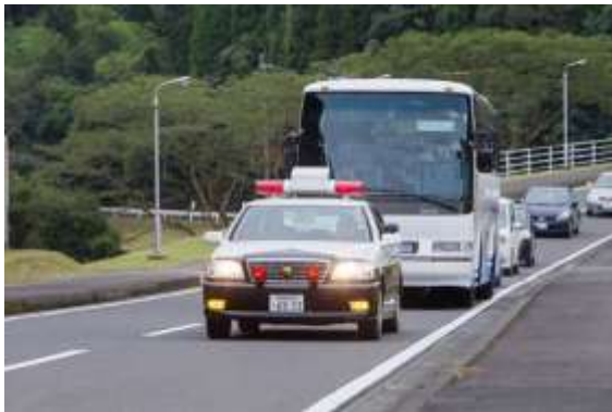
車両による避難 (警察車両による先導)