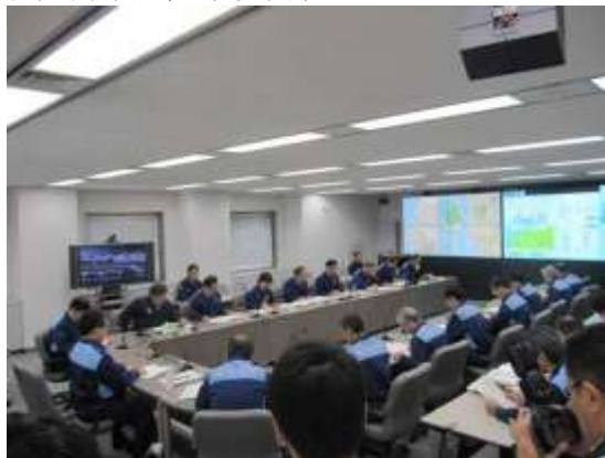
鹿児島県災害対策本部