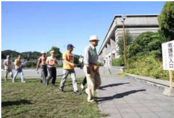
救護所（スクリーニングポイント）への参集