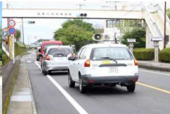
住民避難の呼びかけ② (薩摩川内市広報車)