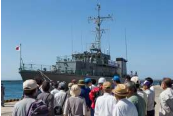
海上輸送による住民避難（海上自衛隊）