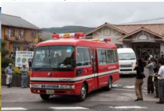
要援護者の避難①（養護施設）