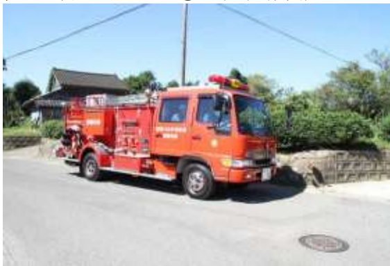
住民避難の呼びかけ① (消防機関)