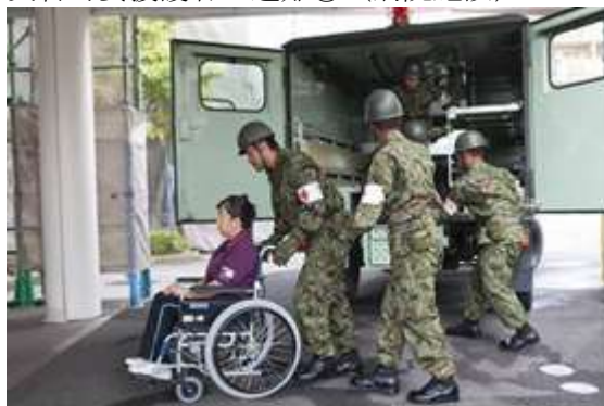
災害時要援護者の避難②（病院施設）