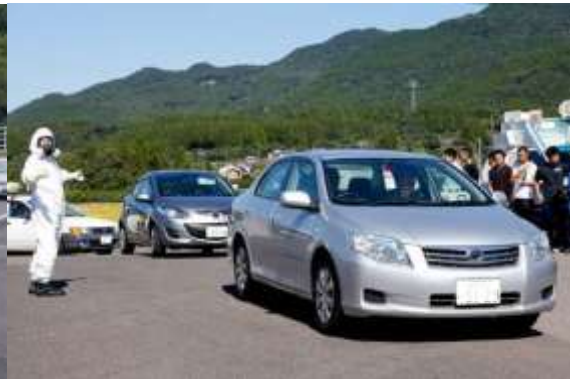
自家用車による避難