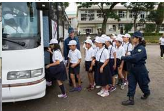
災害時要援護者の避難③（学童避難）