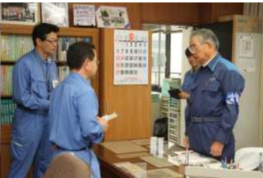
(川内原子力発電所・代替緊急時対策所)