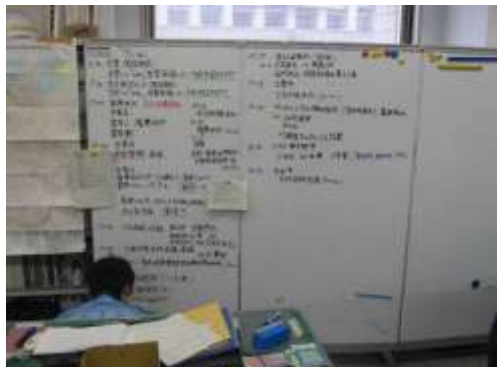
(原子力施設事態即応センター)