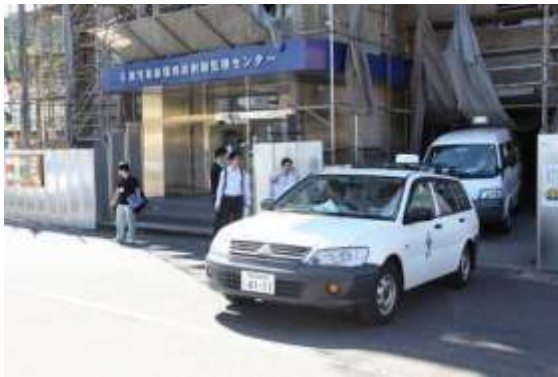
モニタリングカーの展開