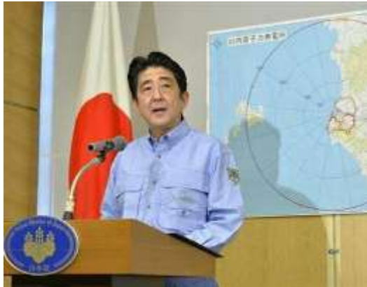
内閣総理大臣による緊急事態宣言