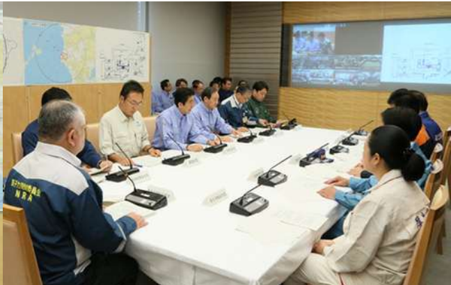
第1回原子力災害対策本部会議