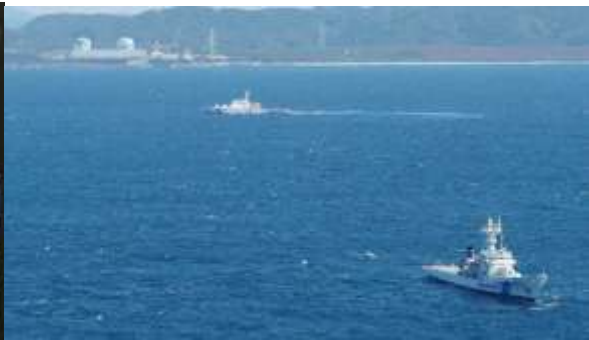
周辺海域における警戒