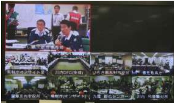
TV会議による情報共有