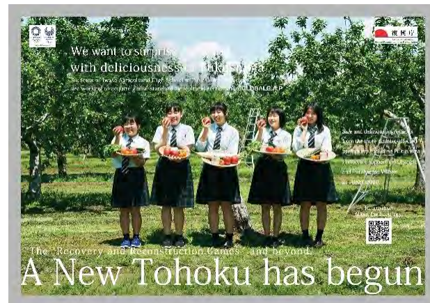
選手村食堂におけるポスターの掲示