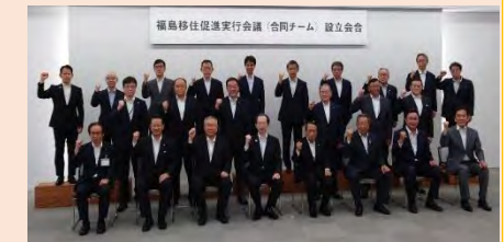
R3.7.9 福島移住促進実行会議(合同チーム)設立会合