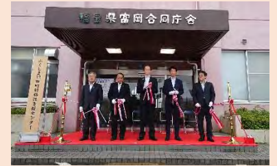
R3.7.9 ふくしま12市町村移住支援センター開所式

復興庁、福島県、12市町村、移住支援センター、経産省、農水省、福島労働局、相双機構、イノベ機構