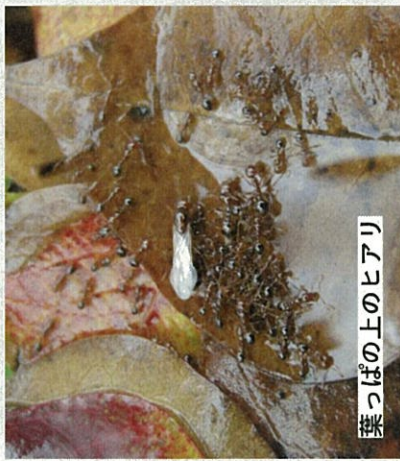
葉っぱの上のヒアリ