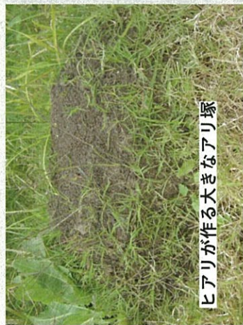
ヒアリが作る大きなアリ塚

これまで存在していなかった危険な毒アリが国内で現れています。 もし発見しても、決して触らないでください！