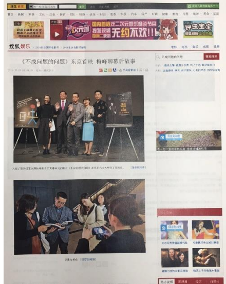
『ミスター・ノー・プロブレム』ジャハンプレミア記事