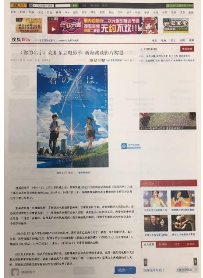
『君の名は。』記事 ※同作は中国にて12月2日公開