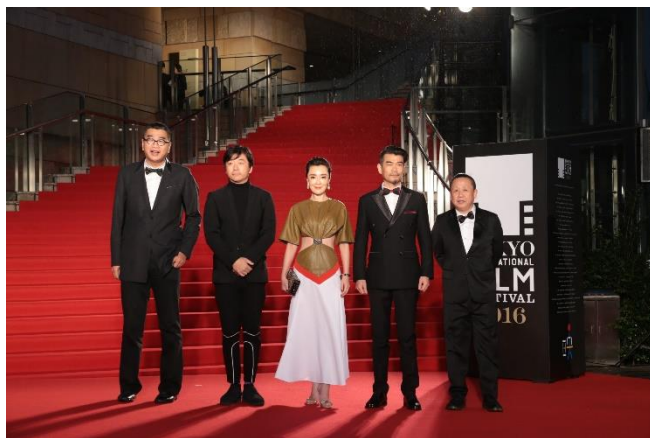
『底辺から走り出せ』シエ・シャオドン監督(最左)