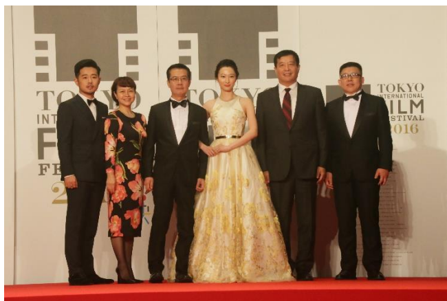
『ミスター・ノー・プロブレム』メイ・フォン監督(左から3人目)