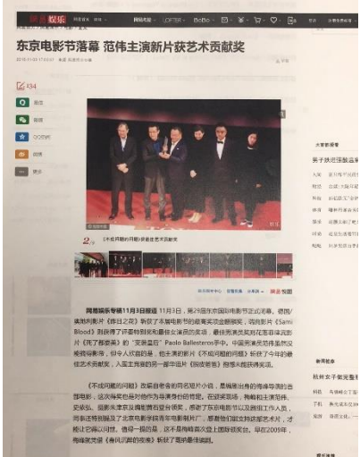
『ミスター・ノー・プロブレム』受賞記事