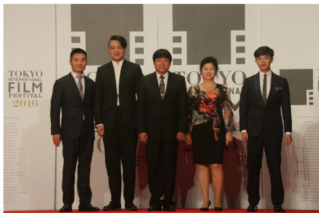
『大唐玄奘』フォ・ジェンチイ監督(左から3人目)

特別上映『大唐玄奘』、コンペティション『ミスター・ノー・プロブレム』などのゲスト参加。