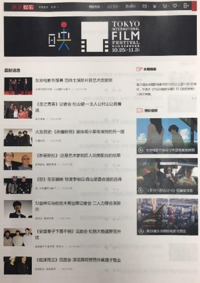
東京国際映画祭特集記事