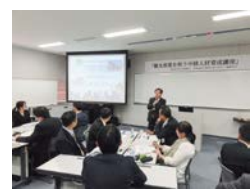
マーケティング調査、観光戦略の策定