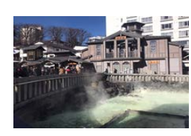
個別施設の収益力向上支援