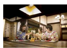
地域内の各種施設の連携強化